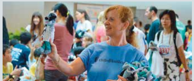
Idi Pebrero 14th, Keiki 12 ken ub-ubing ket nakipagsalisal da ti 2 mile run nga aglikaw idia Neal S. Blaisdell Center idia 2015 Keiki Great Aloha Run. Ti UnitedHealthcare ket nagisponsor met iti dayta a pasamak.