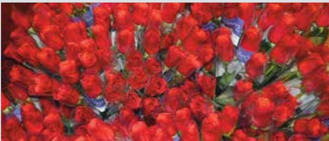
Ti UnitedHealthcare Community Plan of Hawai'i ket nagibunong ti ngangani 400 a rosas nga addaan atitiddog a sanga idia New Hope Oahu ministries idi Mother's Day.