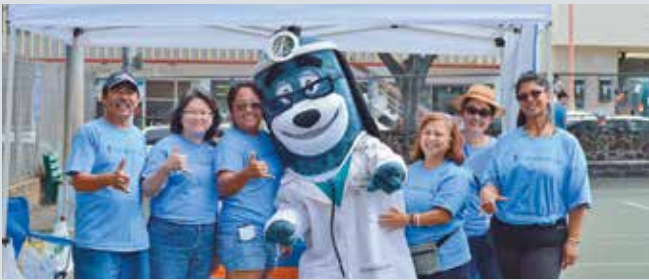
Dagiti nagboluntaryo ken ni Dr. Health E. Hound ket nagited kadagiti espesyal a regalo ken Keiki iti Kaimuki District Park Annual Easter Egg Hunt a napasamak idi Marso 28.