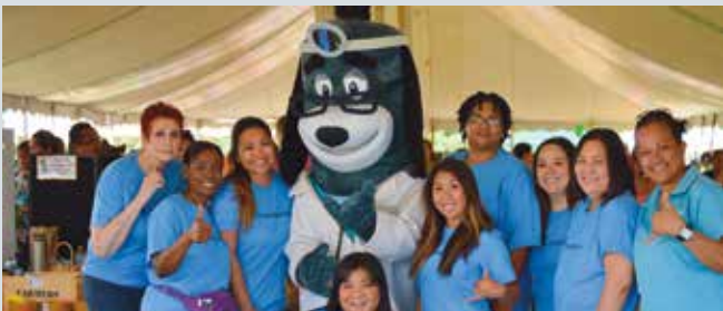
Dagiti adda ti ruar a mangar-aramid ti serbisyo mi ti koordinasyon ket dimmar-ay da ti 10th annual Wai'anae Keiki Spring fest idi Mayo 10 idia napintas a Wai'anae coast.