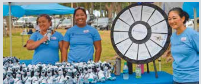
Ti empleado ti UnitedHealthcare Community Plan ket sinuportaranna ti March of Dimes ti amin nga isla. Nakaurnong da ti ngangani $6,000 babaen kadagiti pannagna, ken agtultuloy a panagurnong ken panagbirok ti pondo.