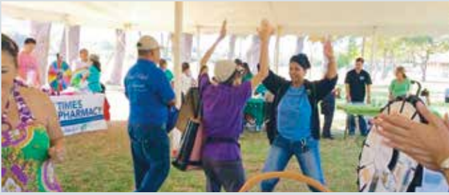
Dagiti boluntaryo nga empleado ti UnitedHealthcare ket dimmar-ay da iti 23rd a tinawen a Filipino Fiesta idi Mayo 9 tapno ibingay dagiti ay-ayam nga addaan pisikal nga aktibidades para kadagiti agtutubo ken nataengan a dimmar-ay.