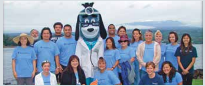
Dagiti empleado manipud East Hawai'i on the Big Island ket nagboluntaryo da idia 18th annual Hilo Heart & Stroke Walk a naaramid idi Marso 7.