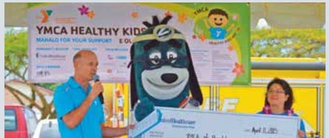
Kas kangrunaan a sponsor nga addaan titulo ti YMCA Healthy Kids Day on Oahu, UnitedHealthcare Community Plan ket inpresentar na iti YMCA iti tseke a $10,000 idi Abril 11.