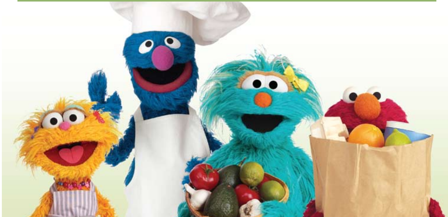
"Sesame Workshop", "Sesame Street" y los personajes, marcas comerciales y elementos de diseño relacionados son propiedad, bajo licencia, de Sesame Workshop. © 2010 Sesame Workshop. Derechos reservados.